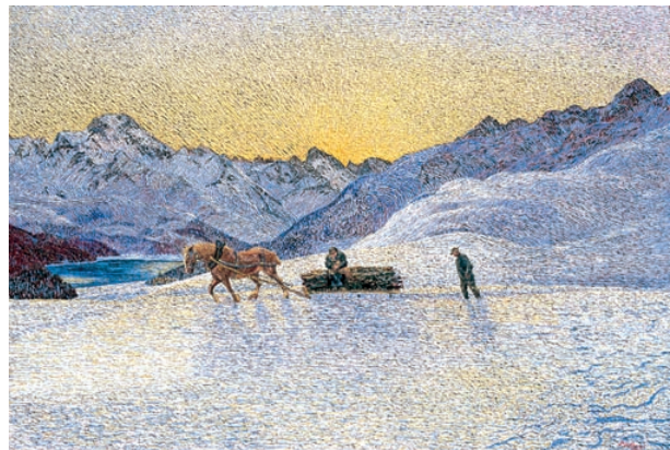
「クリスマスの夕べ」、1899～1901年 キャンバスに油彩（108×159センチ）