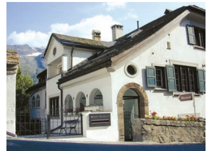
ヴィラ・アローナ、サンモリッツ