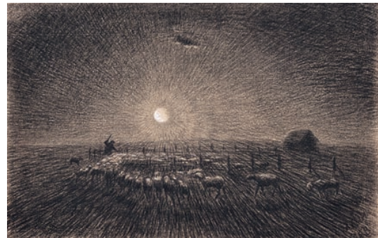
日の入りごろの羊の群れ、1898年 紙に木炭（45×33センチ）